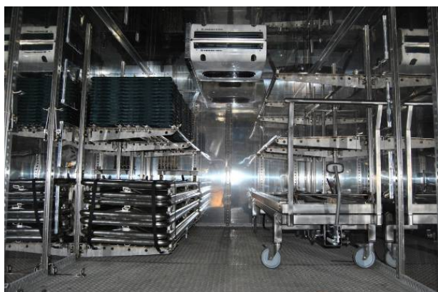
Mortuary Container - Internal view Conteneur mortuaire - vue interne

Mortuary Container is designed for temporary storage of dead men.