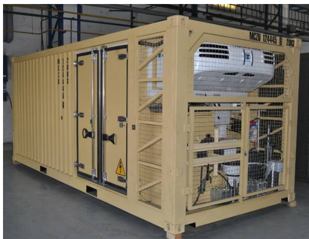
Mortuary Container - External view Conteneur mortuaire - vue externe