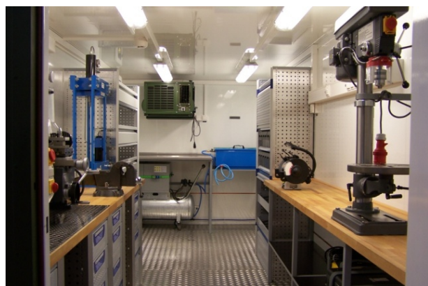
Automotive Repair Workshop - interior Atelier réparations automobiles - intérieur