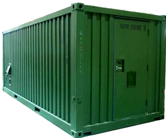
Workshop - external view Atelier - vue externe