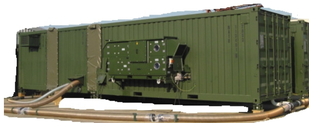
500 Men Laundry - External view Blanchisserie pour 500 - vue externe

Each unit is heated and air conditioned and contains specific equipment for: