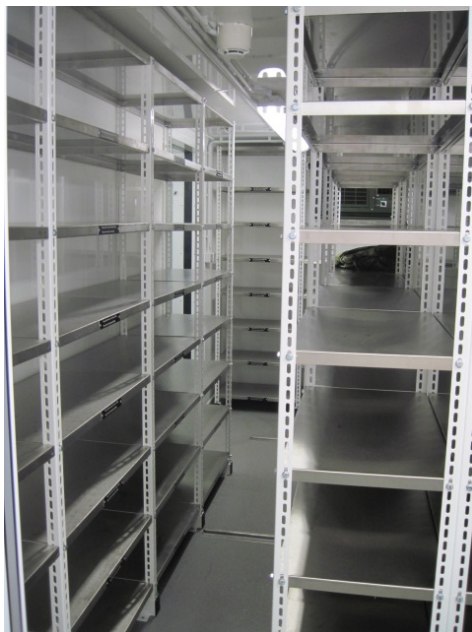
Laundry Pick Up Unit DISTRIBUTION de linge